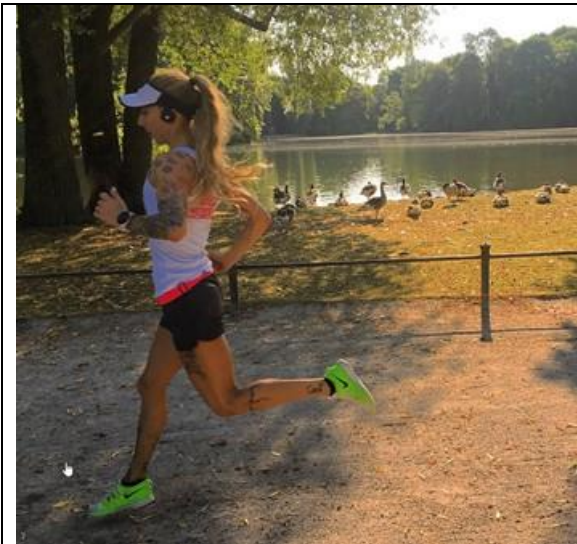
Foto: englischer Garten. Hier gehen die Laufstrecken durch.